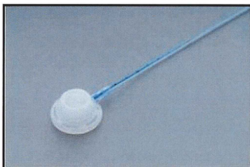
▲ CVポート (MRIポート)