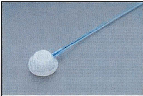
▲ CVポート (MRIポート)